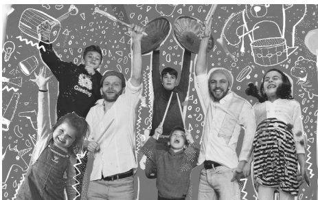
Double Drums: Groovin' Kids (Plakatausschnitt)

Illustration: Paul Grabowski